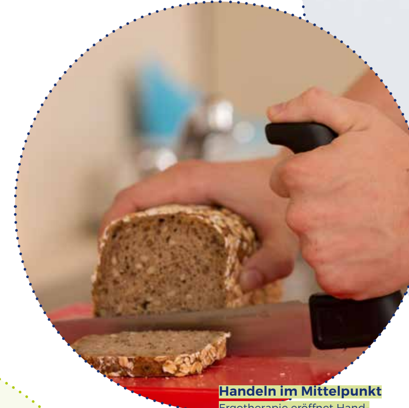
Handeln im Mittelpunkt Ergotherapie eröffnet Handlungsmöglichkeiten, die Gesundheit und Lebensqualität stärken.

Herausragend für die Ausbildung zur/m Ergotherapeut*in an der FHWN ist, dass innerhalb des Studiums Produkte entstehen, die tatsächlich in der Praxis Umsetzung finden - wie etwa ein Fachvortrag, ein Interventionskonzept, eine Übersetzung eines englischsprachigen Tools für die Befundung von Kindern, Folder zu verschiedenen Themen und vieles mehr. Studierende werden auch an aktuellen Projekten des Studiengangs, wie etwa der demenzfreundlichen Bibliothek, beteiligt.