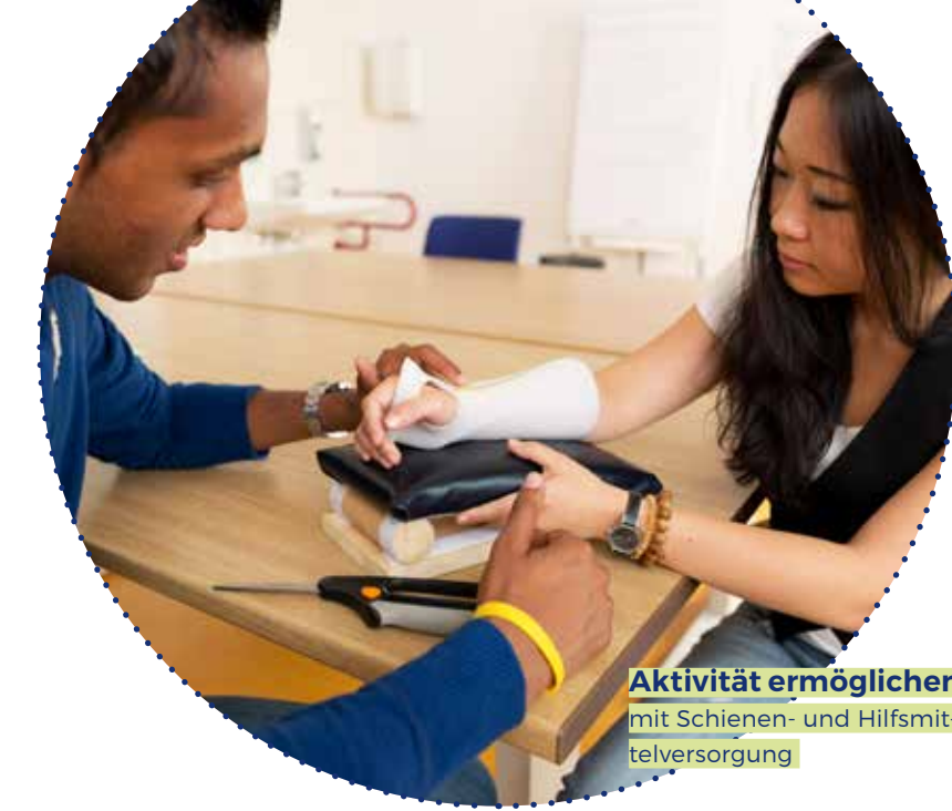
Aktivität ermöglichen mit Schienen- und Hilfsmittelversorgung