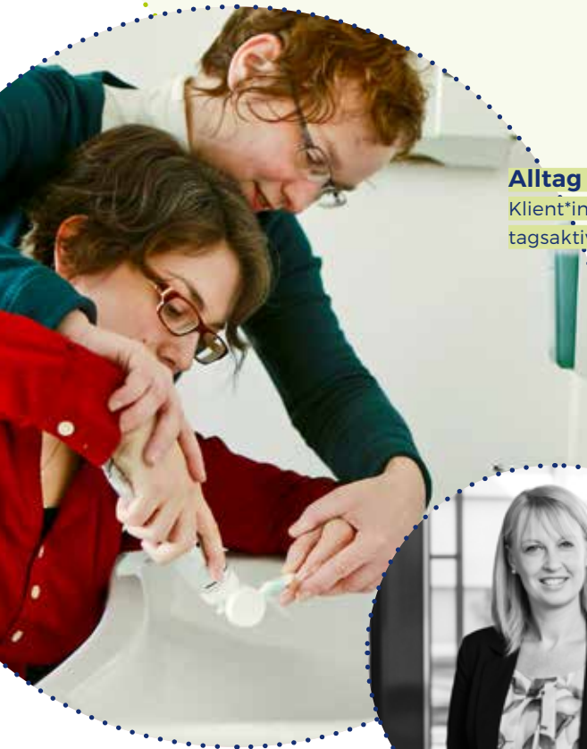
Alltag möglich machen Klient*innen bei relevanten Alltagsaktivitäten unterstützen