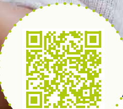
QR-Code scannen & Podcast starten!