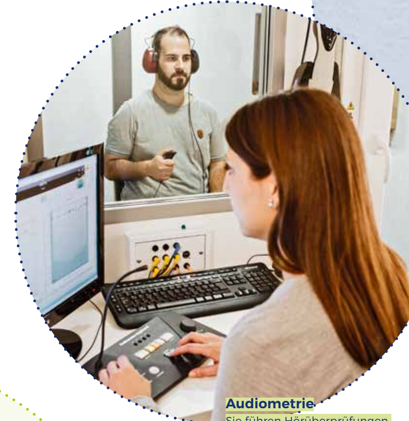
Audiometrie Sie führen Hörüberprüfungen unter realen Bedingungen durch.