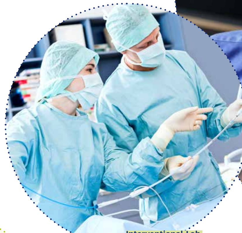
Interventional-Lab: Übungen für Angiographie und Interventionelle Radiologie

Für die Studierenden besteht sowohl die Wahl Fragestellungen aus den Praktikumsstellen auszuarbeiten, als auch die Möglichkeit zur Mitarbeit an Forschungsprojekten des wissenschaftlichen Personals an der FH Wiener Neustadt. Auch eigenständige Themenvorschläge können aufbereitet werden und leisten damit auch oft einen Beitrag zur persönlichen Weiterentwicklung durch Forschung.