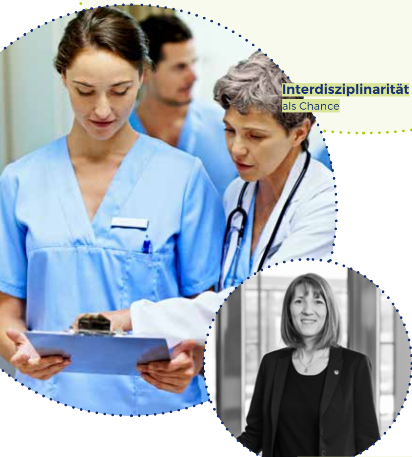
Interdisziplinarität als Chance