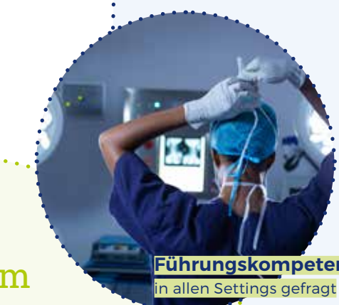
Führungskompetenz in allen Settings gefragt