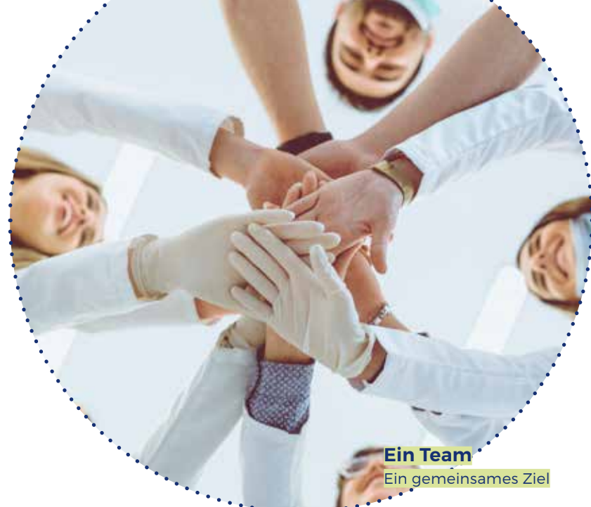
Ein Team Ein gemeinsames Ziel