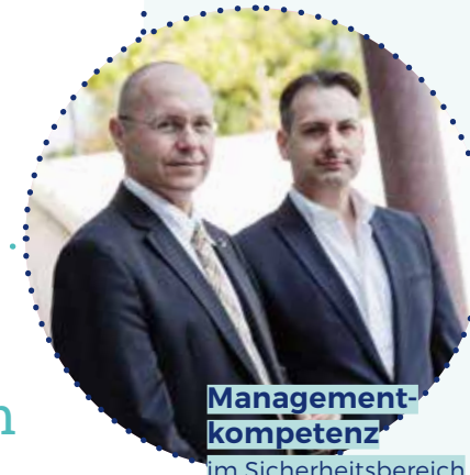
Managementkompetenz im Sicherheitsbereich

Das Curriculum umfasst die Module Sicherheit, Strategie, Management, Recht, Persönlichkeit & Wissenschaftliche Kompetenz.