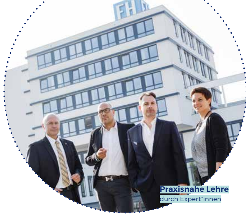
Praxisnahe Lehre durch Expert*innen