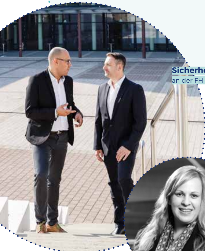
Sicherheit studieren an der FH Wiener Neustadt