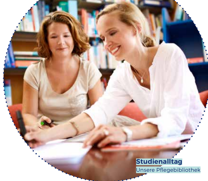
Studienalltag Unsere Pflegebibliothek

Dieser Master-Lehrgang berechtigt Sie außerdem zu einem weiterführenden Doktorats-Studium.