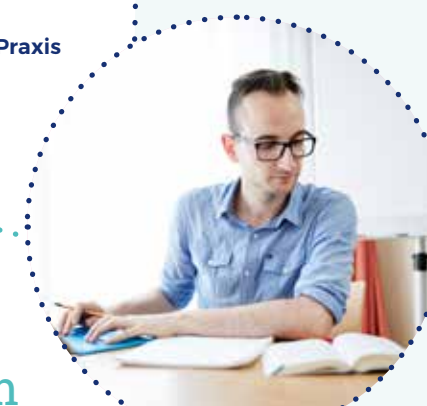
Forschung in die Praxis integrieren

Durch dieses Projekt haben Sie die Chance, Entwicklungspotentiale Ihrer eigenen Praxis zu orten und eine definierte Fragestellung aufzugreifen. Sie lernen an diesem konkreten Problem, wie und wodurch eine solche Frage erfolgreich bearbeitet werden kann. Sie werden Schritt für Schritt von uns begleitet und erleben direkt wie Wissenstransfer gelingt.