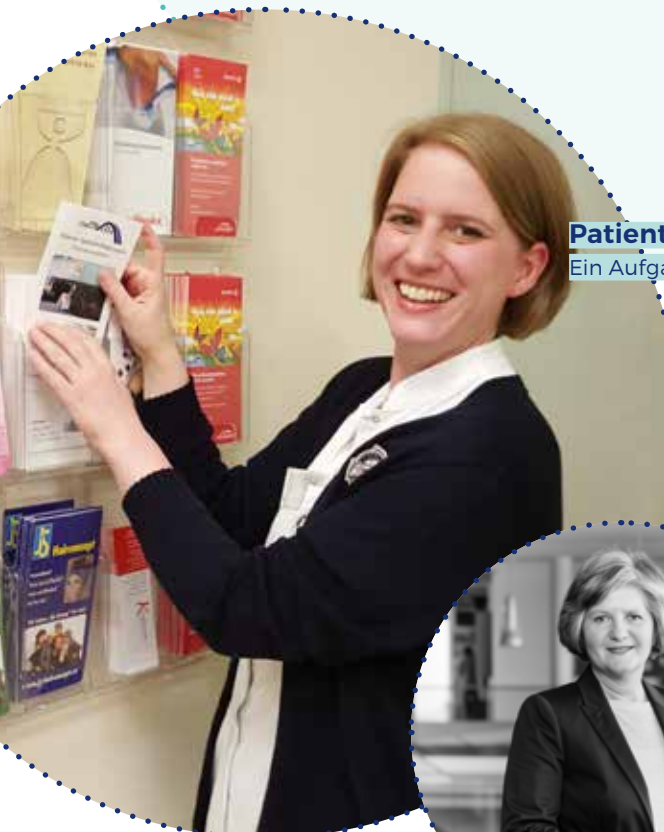
Patient*innenedukation Ein Aufgabengebiet einer APN