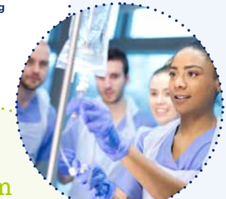
Theorie – Praxis Transfer

Es findet ein intensiver Erfahrungsaustausch statt, der Sie zu einem Perspektivenwechsel anregt und Sie dazu motiviert, voneinander zu lernen.