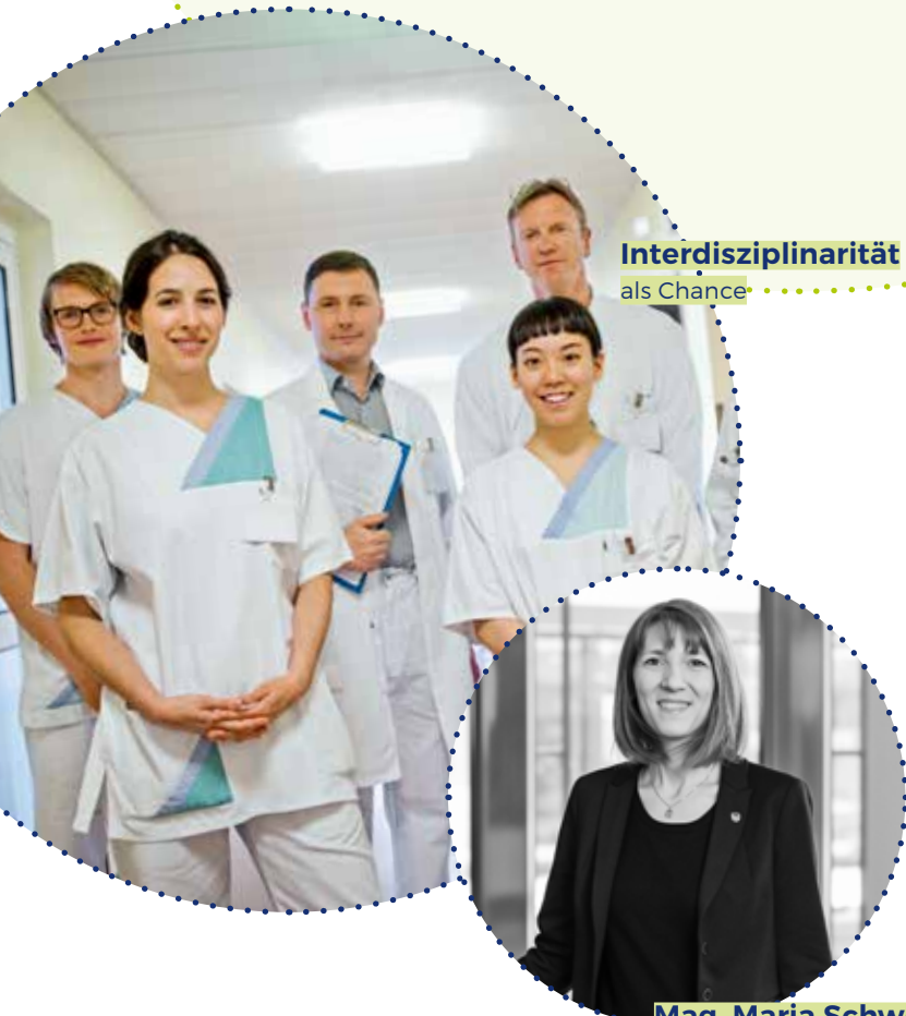
Interdisziplinarität als Chance