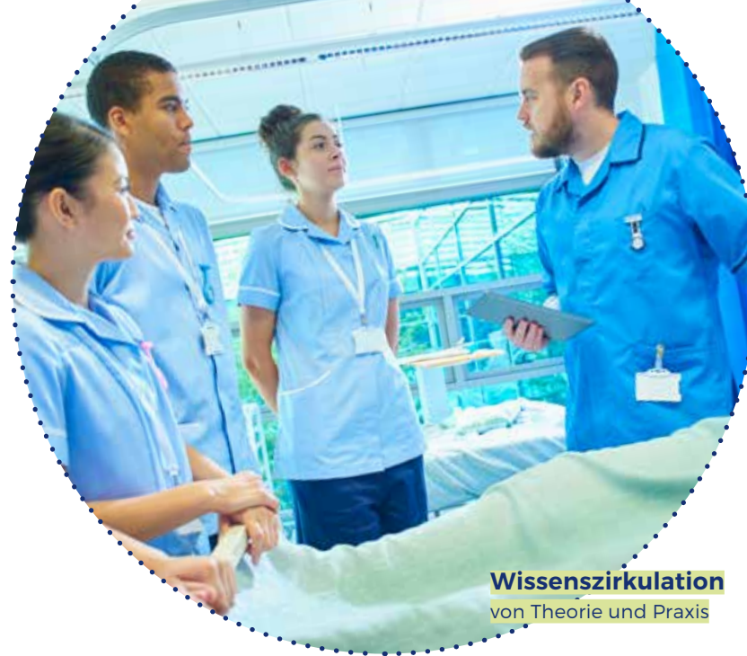
Wissenszirkulation von Theorie und Praxis